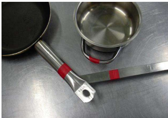
Slika 3. označavanje posuđa koje se koristi isključivo za pripremu bezglutenske hrane

pribor i pomagala koja se koriste isključivo za pripremu bezglutenskih obroka kako bi bili prepoznatljivi i kako bi korisnika podsjećali na povećan oprez prilikom pripreme. Važno je da se takav pribor čuva na različitim mjestima kako bi se izbjegla mogućnost križne kontaminacije glutenom.